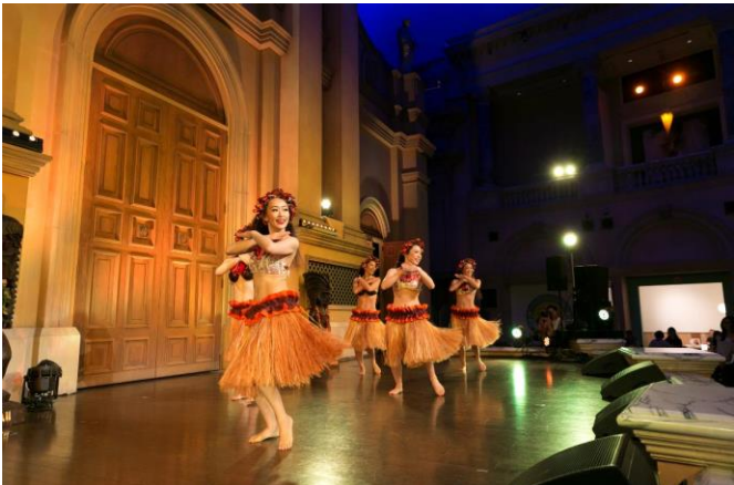
【パレットプラザ内 特設ステージ】 ステージサイズ: 幅10.8m × 奥行8.1m ※変更になる場合がございます。